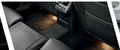
Najprostranija unutrašnjost u klasi