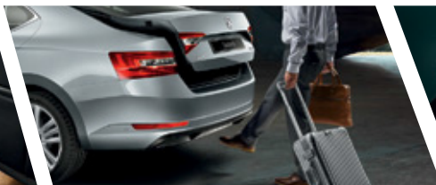
Virtualna papučica za prtljag