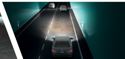
Smart Light Assistant