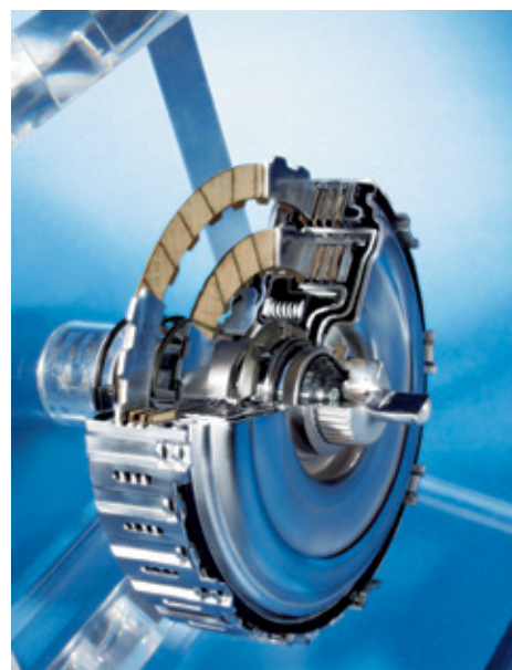
> Jedan od najomiljenijih mjenjača s dvije spojke, popularni DSG, dostigao je prodaju veću od 3,5 milijuna primjeraka