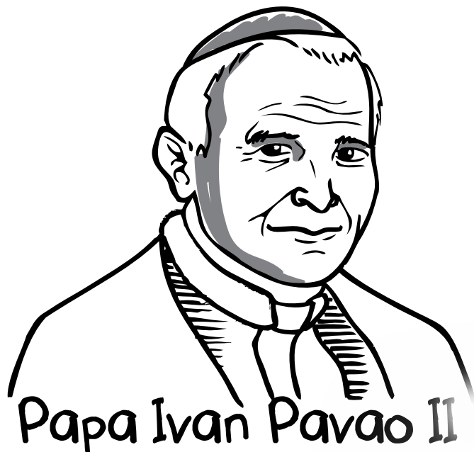
Papa Ivan Pavao II