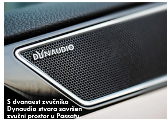
S dvanaest zvučnika Dynaudio stvara savršen zvučni prostor u Passatu.

datni 2-stazni sustav, s dvije dodatne kalote od tkanine veličine 60 mm, upotpunjuje konfiguraciju zvučnika. Stražnji zvučnici u Surround modusu služe kao efektni zvučnici prvog reda sjedala. Jedinstvena karakteristika na području automobila je Dynaudio tehnologija na području srednjih i dubokih tonova: ovdje se koriste membrane od magnezij-silikat-polimera (MSP materijal) te iznimno lagani aluminijski titrajni svici, koje pokreću unutrašnji magneti. Kod manje potrebe za prostorom i težinom ova složena konstrukcija omogućuje snagu i preciznost, dinamičnu reprodukciju dubokog basa te čistu i neiskrivljenu reprodukciju srednjih tonova. Koriste se ukupno četiri dubokotonska zvučnika veličine 200 mm i dodatan subwoofer, koji unutrašnjost Passata ravnomjerno opskrbljuje dubokim frekvencijama. U